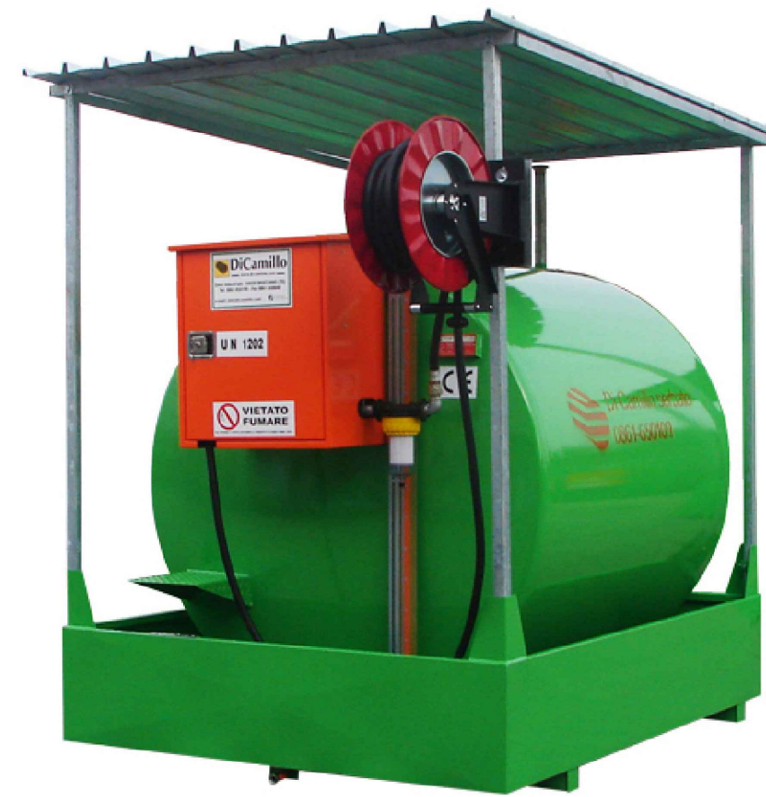
FOTO 1 - SERBATOIO GASOLIO CON TETTOIA